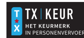
logo invers (diapositief)