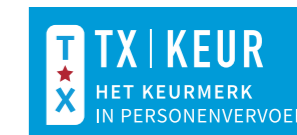
logo invers (diapositief) op blauw

Voor de diverse toepassingen van het logo zijn er varianten gemaakt.